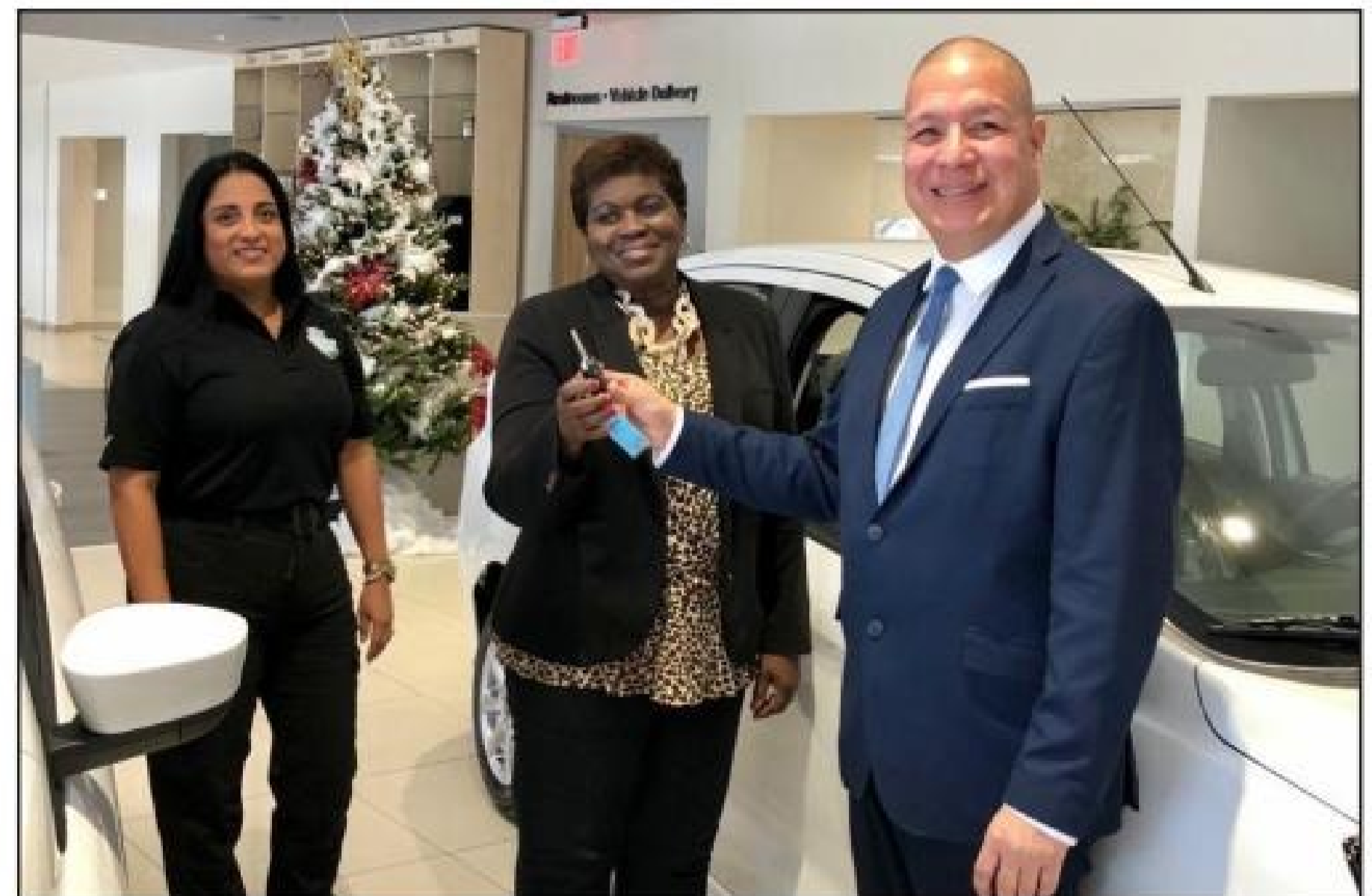
Aruba na Vondelaan.

Diabierna merdia Minister Bikker a bay inspecciona e trabownan andando na e compleho Hudicial nobo na Wayaca, caminda entre otro ta remodelando un compleho di edificio pa por bira oficinanan moderno pa entre otro e Departamento di Recherche y varios otro Departamento di KPA. E trabounan ta andando segun schedule y pronto lo por muda e diferente Departamento di KPA pa e compleho di edificio.